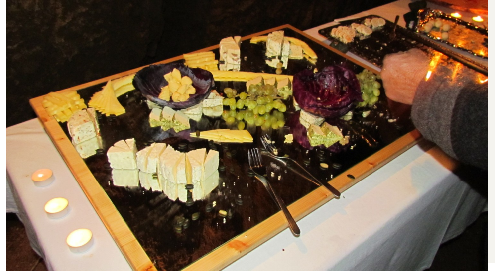
Auf Grund der enge konnte ich das Buffet nur noch „geplündert“ fotografieren