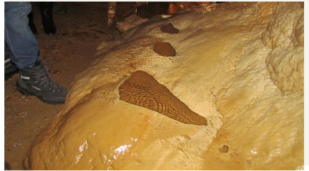
Sagen über die Lurgrotte lustig erzählt