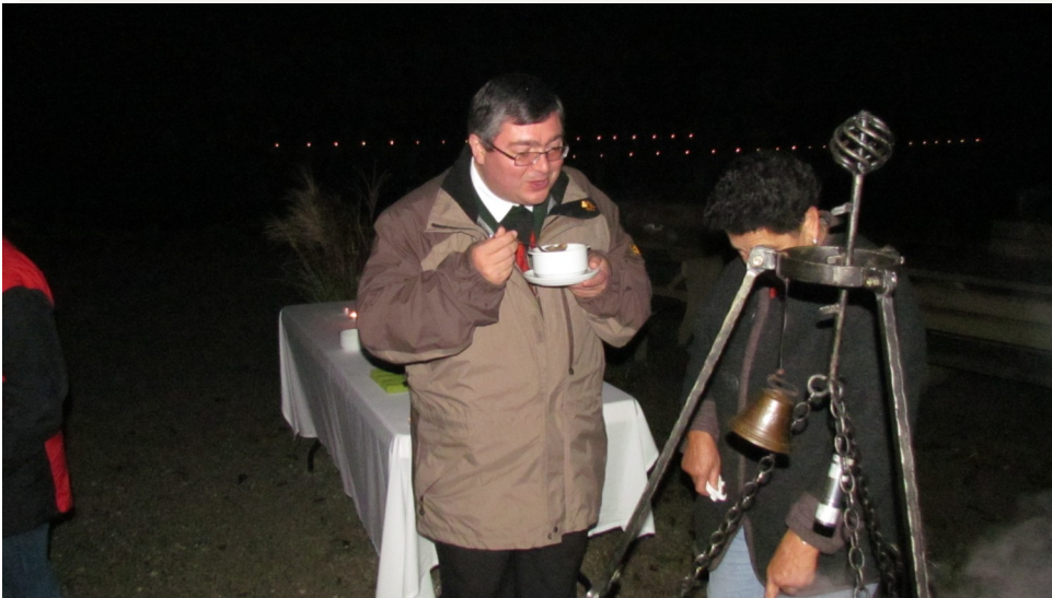
Ein Genießer beim Löffeln der Kürbiscrèmesuppe