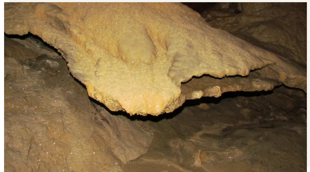
Schmausen unter Tage.