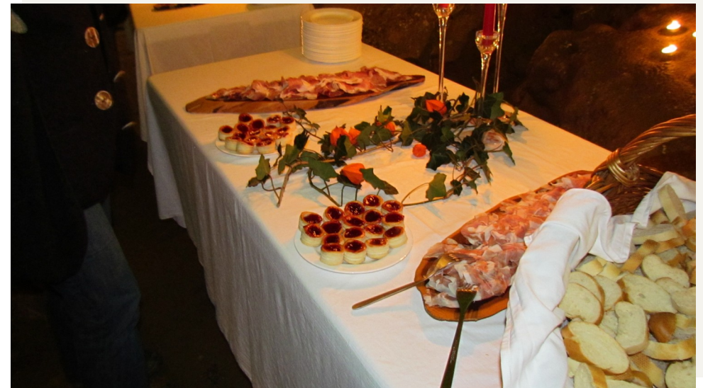
1 Labestation. Gutes von den örtlichen Bauern.